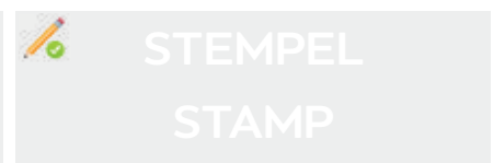
Firmenstempel und rechtsverbindliche Unterschrift Stamp and obligatory signature